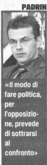
PADRIN «Il modo di fare politica, per l'opposizione, prevede di sottrarsi al confronto»

LE CAUSE - Quali sono i motivi che hanno portato a un simile passivo? Sul tema è intervenuto Ennio Soccà: «I problemi si sono aggravati perché l'intera struttura, che comprende anche il palasport, non è mai stata interamente